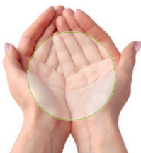
Dos palmas de la mano Cantidad de verduras

La falta de control en las porciones es una de las razones que explican el sobrepeso. Un truco sencillo para evitar el exceso de grasas y calorías es estimar las porciones diarias que cada persona necesita en función de la propia mano.