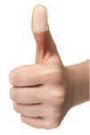
La punta del pulgar Cantidad de aceite diario