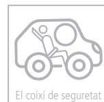
El coixí de seguretat