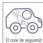
El coixí de seguretat