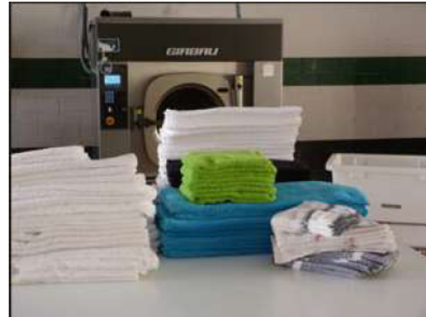
LAVADO DE ROPA