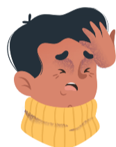
Sensación de falta de aire