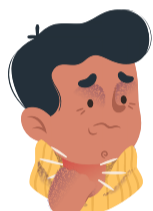
Dolor de garganta